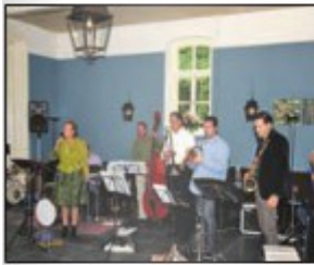
Muziek in het voormalige klooster Duinigt.