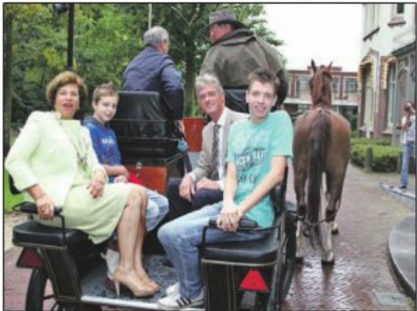
Twee prijswinnaars van de Leo Kannerschool gingen mee voor een ereronde op de koets, samen met de burgemeester en de wethouder.