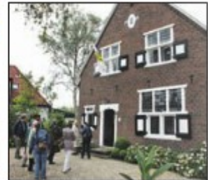
De Meindochter van Jesse had veel toehoorders in het Jessehuis aan de Marelaan.