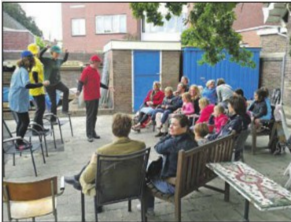
Terwijl de ouders in de voormalige Gevers-Deutz Bewaarschool de verbouwing bewonderden, genoten hun kinderen van een voorstelling van Toneelvereniging Ploef.