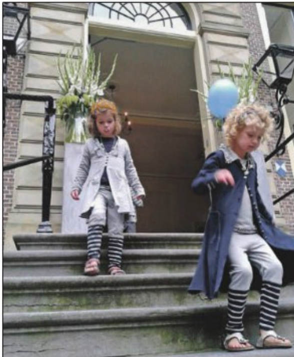
Kinderen konden zich op Oud-Poelgeest heel even prinses voelen.