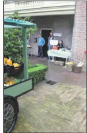
Er moest lang voor de regen worden geschild op de binnenplaats van Kasteel Endegeest.