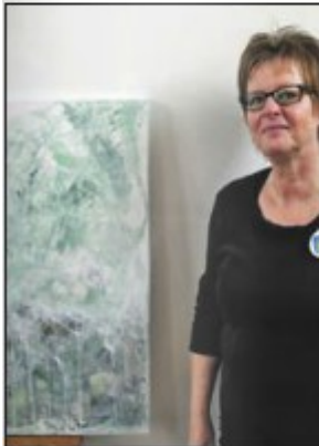
Osgier bood veel kunstenaars de gelegenheid hun werk tentoon te stellen.