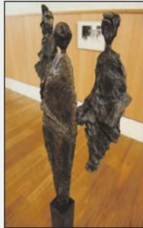
Een kunstwerk in de Regenboogkerk aan de Mauritslaan.